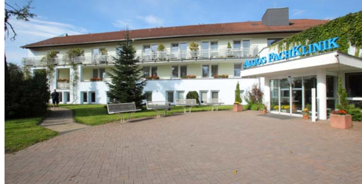
Celenus Algos Fachklinik