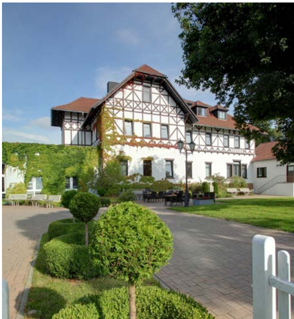
Celenus Algos Fachklinik

Weiterführende medizinische Spezialuntersuchungen (z. B. Röntgen, CT, MRT, Szintigraphie) erfolgen bei Bedarf in Kooperation mit naheliegenden Krankenhäusern und niedergelassenen Fachärzten.