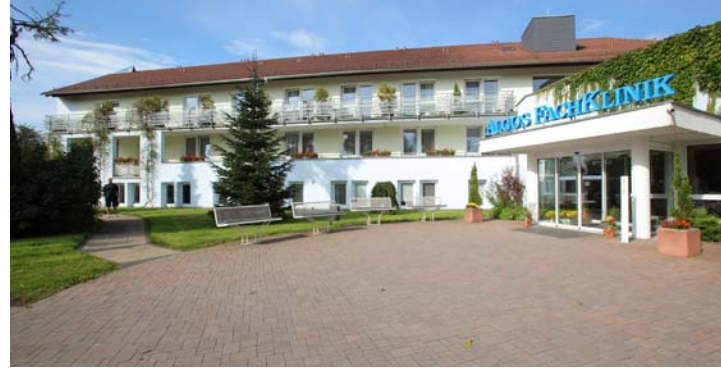
Celenus Algos Fachklinik