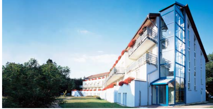
Celenus Algos Fachklinik